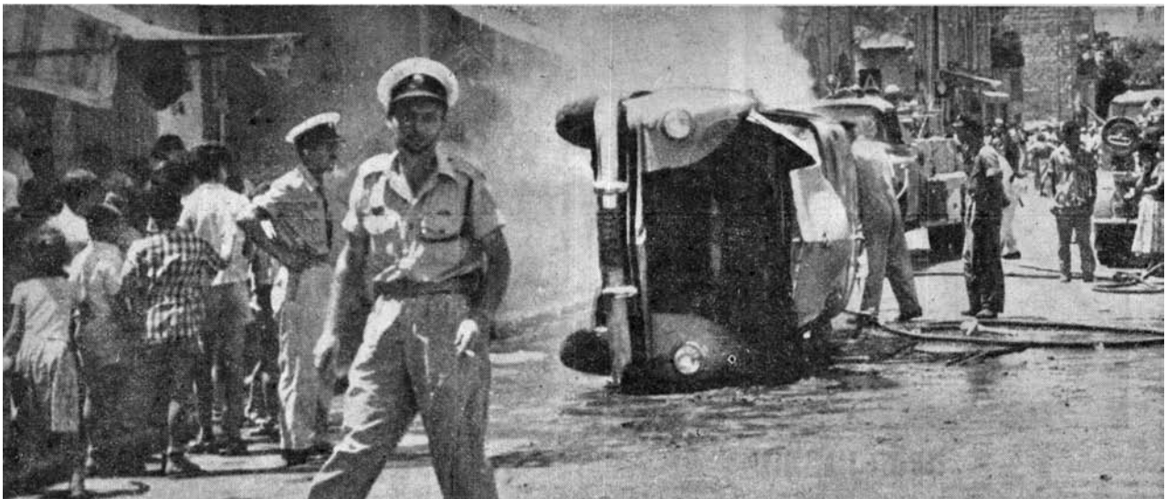
הכבאים מטפלים במכונית שנהפכה על ידי המתפרעים ועולה באש

כמה מאות יוצאי צפון אפריקה, תושבי שכונת ואדי סאליב בעיר התחתית בחיפה, ערכו במשך יום אתמול התפרעויות רציניות בתגובה על פציעתו של שיכור בן עדתם על ידי המשטרה. המתפרעים כילו את זעמם בחנויות ובמכוניות. 13 שוטרים נפצעו בהתנגשויות עם המתפרעים, ושלושה מהם נשארו בבית החולים לשם קבלת טיפול נוסף. [...]